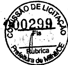
PLANILHA DE ENCARGOS SOCIAIS SOBRE A MÃO DE OBRA - SEINFRA