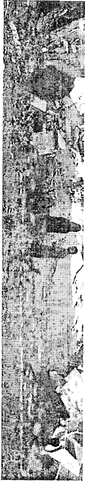
Mais de 30 mil pessoas foram mortas em meio à violência entre o Hamas e o governo de Israel

No sábado, um alto funcionário norte-americano detalhou que "a princípio, os israelenses aceitaram os elementos do acordo". Porém, até o momento de produção desta reportagem, o governo de Benjamin Netanyahu não havia confirmado tais informações. Ontem, um alto líder do movimento islamista afirmou à mídia internacional, sob condição de anonimato,