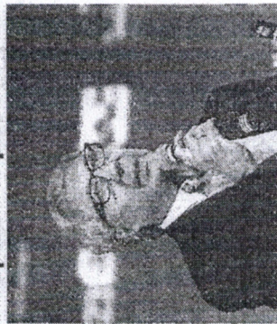
YouTube. “Brasil: Cenário e perspectivas na visão de

O empresário Abílio Diniz é o convidado do Ciclo de Estudos, projeto desenvolvido pela CDL de Fortaleza e Faculdade CDL, marcado para o próximo dia 9 de junho, às 18 horas, ao vivo, pela plataforma do YouTube. “Brasil: Cenário e perspectivas na visão de