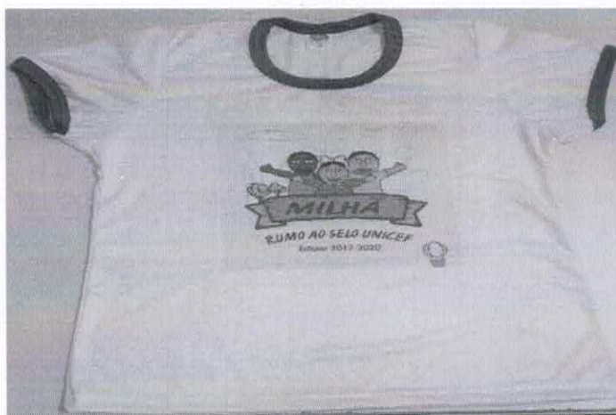
Figura 5- ITEM 1.4 - FRENTE