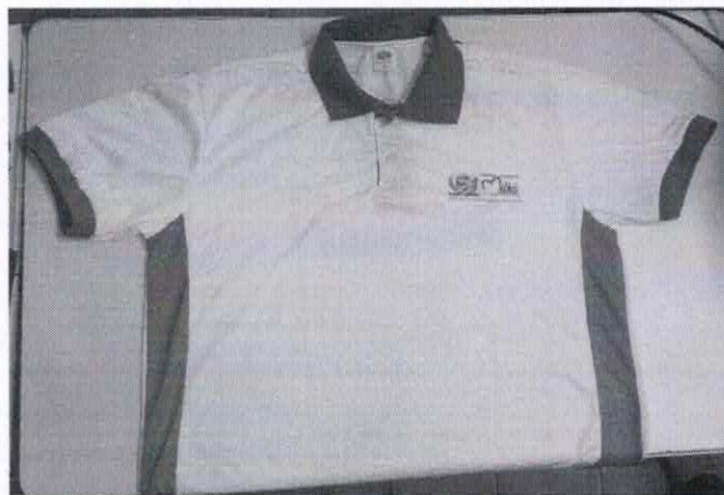
Figura 2-ITEM 1.2 - FRENTE