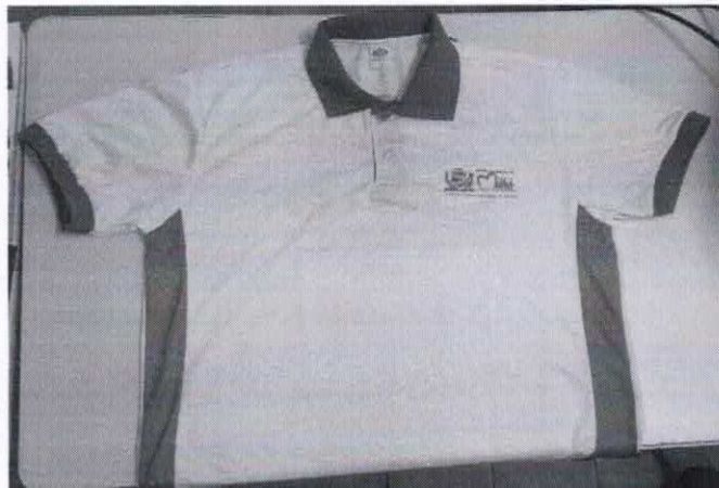
Figura 1- ITEM 1.1