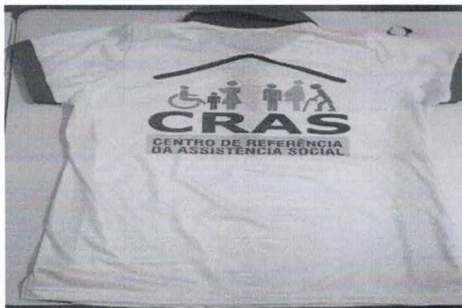
Figura 3- ITEM 1.2 - COSTA