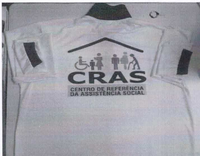
Figura 8- ITEM 1.5 COSTA