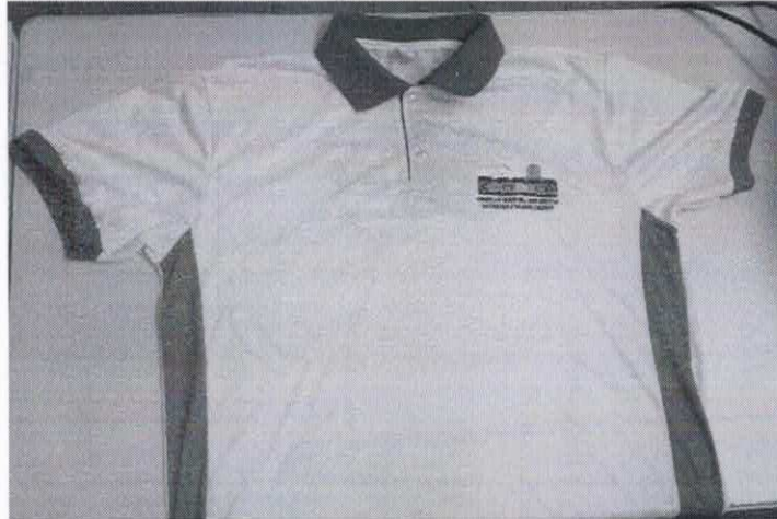
Figura 9 - ITEM 2.1