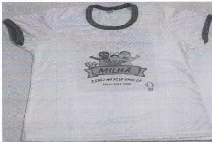
Figura 4- ITEM 1.3