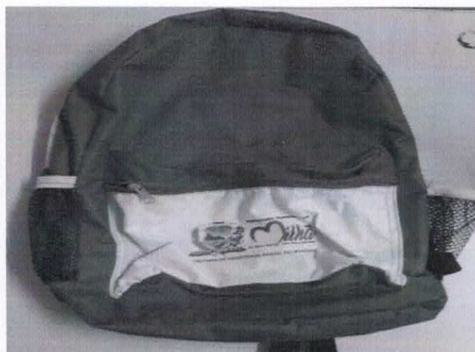
Figura 16- ITEM 4.1