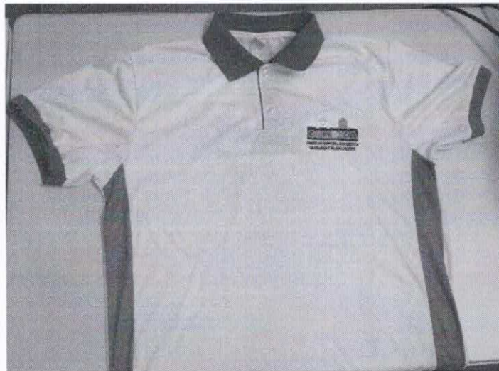
Figura 10- ITEM 2.2 - FRENTE