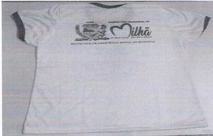
Figura 6 - ITEM 1.4 - COSTA