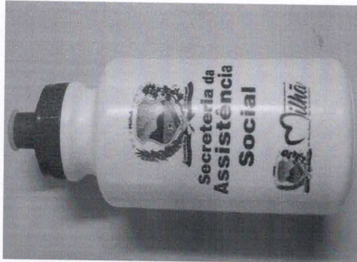
Figura 17 - ITEM 5.1