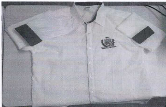
Figura 15 - ITEM 3.2