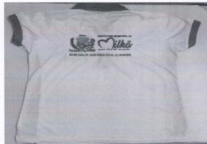
Figura 13- ITEM 2.3 - COSTA