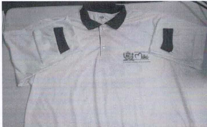
Figura 7- ITEM 1.5 FRENTE