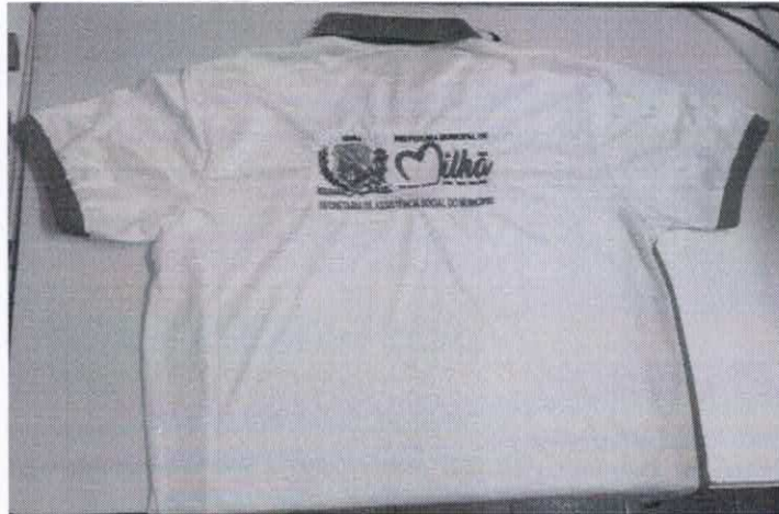
Figura 11 - ITEM 2.2 - COSTA