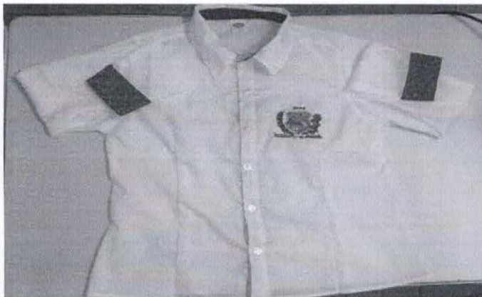
Figura 14- ITEM 3.1