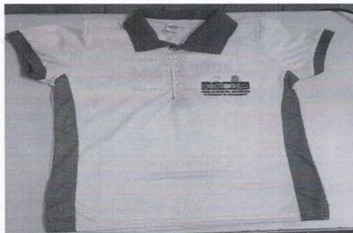
Figura 12 - ITEM 2.3 - FRENTE