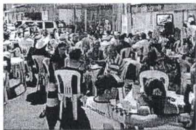
De dia, orações, penitências e passeios; à noite, muita diversão na Praça dos Romeiros e na Praça Padre Cícero e intenso folclore.

Juazeiro do Norte. No início na noite, a Praça Padre Cícero já começa a receber dezenas de romeiros. Os bares e restaurantes já estão lotados. O "tremzinho da alegria" começa a dar os primeiros passeios entre a Basílica Menor de Nossa Senhora das Dores e a praça principal da cidade. Além disso, a Praça dos Romeiros recebe parques de diversão, barracas de algodão doce, batata-frita, sorvete. Uma grande festa toma conta das ruas.