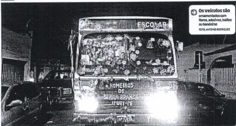
Os veículos são ornamentados com flores, adesivos, balões ou bandeiras